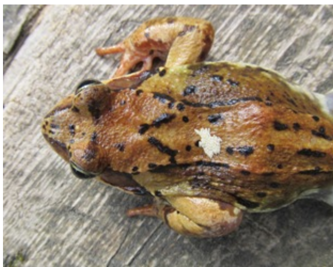
Рис. 1. Кладка яиц Lucilia bufonivora на спине Rana temporaria . Заповедник «Кивач», 2011 г.

В июне 2014 г. в окрестностях биологической станции Петрозаводского государственного университета (с. Кончезеро, Кондопожский район, 62°07' с. ш. 34°01' в. д.) была отловлена самка травяной лягушки ( R. temporaria ) с явными признаками заражения личинками мухи-лягушкоедки, которые располагались у нее в ноздрях. Описанные в литературе (Гаранин, Шалдыбин, 1976; Weddeling, Kordges, 2008 и др.) кладки на спине лягушки (рис. 1) нами не отмечены. Масса лягушки 25,5 г, размеры ~ 5 см. Для дальнейшего наблюдения лягушка была помещена в террариум с травой и влажным дерном, прикрытый сверху марлей. Наблюдения проводились в помещении при комнатной температуре в течение нескольких дней.