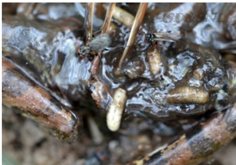
Рис. 4. Личинки лягушкоедки перед окукливанием. Момент заражения наездником Fig. 4. The larvae of Lucilia bufonivora before pupation. The moment of infection by the rider

Видео. Наездник заражает личинок Lucilia bufonivora Video. Rider infects larvae of Lucilia bufonivora