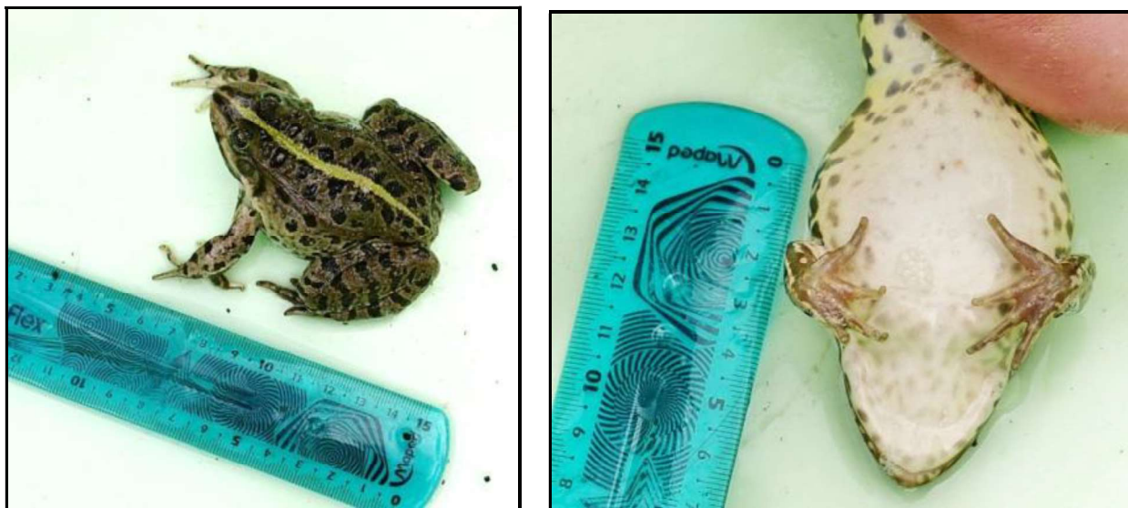
Рис. 1 и 2. Лягушка из окр. с. Узьян 25.05.2020 г.

суживающая к началу морды и к концу тела; низ был – без пятен (рис. 2). Длина лягушки составляла 8 см, зрачок продольный.