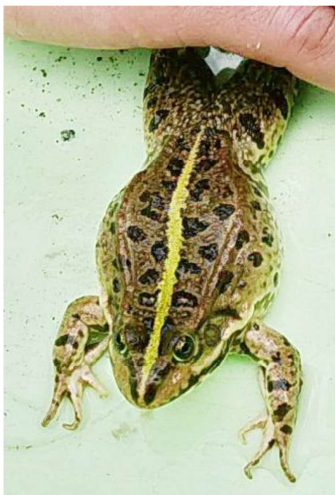
Рис. 3. Височное пятно.

Височное пятно после глаза уже, чем до глаза, и раздваивалась у плеча на два отрезка: короткий, уходящий к передней лапе, и длинный, продолжающийся до середины живота (рис. 3).