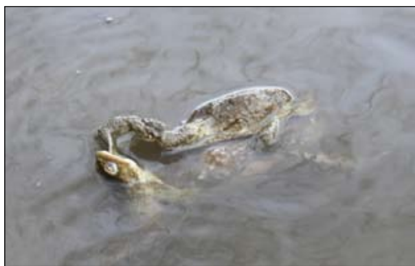
Захватчик может попытаться разбить сложившуюся пару и на суше (фото слева), и в воде. Исход сражения зависит не только от удачи, но и от силы и ловкости самцов.