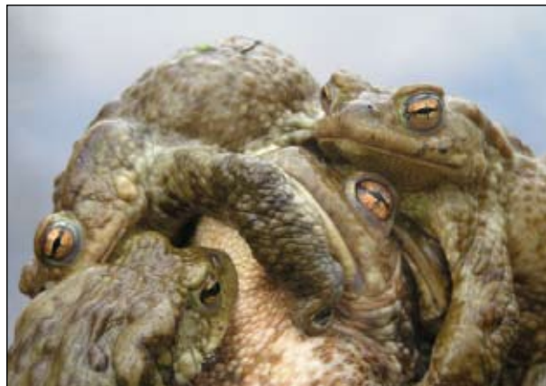
Самцу (фото слева) повезло: он доедет до водоема на самке. А этой самке, вероятно, совсем нелегко: ее помогают сразу несколько самцов.