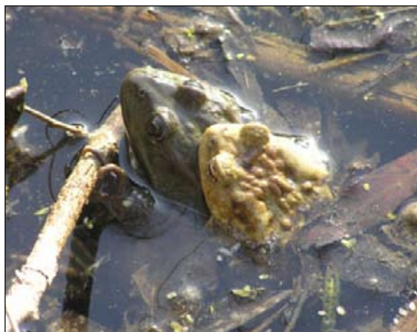
Серая жаба держит в амplexусе зеленую лягушку.

Надо же, как только не переплетаются любовь и смерть! ■