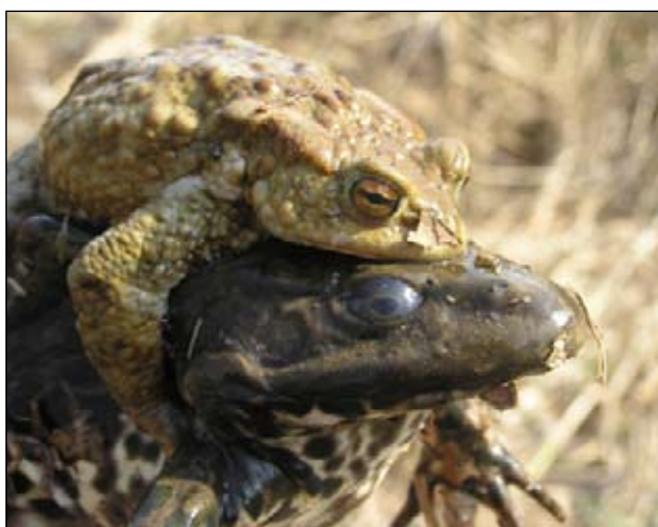
Глаза самки озерной лягушки скрыла мутная поволока; самец серой жабы, судя по всему, полон энтузиазма.