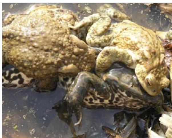
А эта озерная лягушка оказалась крупнее и потому — привлекательнее.