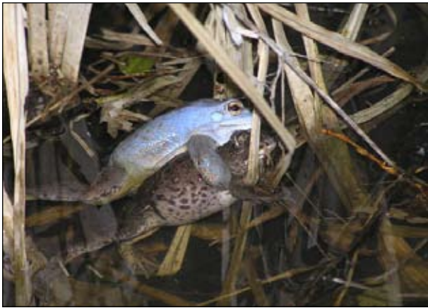
Сверху — самец остромордой лягушки в голубом брачном наряде, снизу — чесночница (обратите внимание на вертикальный зрачок).