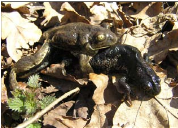
А самец гребенчатого тритона уж точно тут ни при чем: у хвостатых амфибий оплодотворение внутреннее. Увы, у самца чесночницы крепкая хватка.