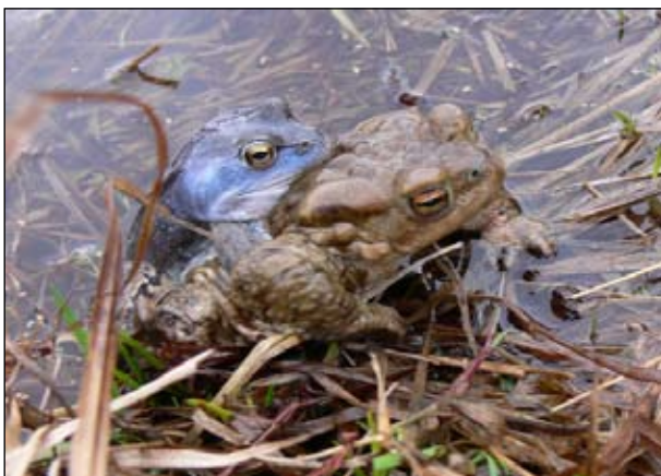
Понятно, чем закончится такой гетероспецифичный амplexус: самцу остромордой лягушки станет дурно от воздействия яда серой жабы и он разомкнет свои объятия.

много, они пытаются схватить друг друга в амplexус, но всегда вырываются и отвечают характерным «мужским» криком высвобождения. В результате такого поведения группа пойманных на нересте самцов серых жаб издает звуки, напоминающие чирикающие выводка цыплят или утят.