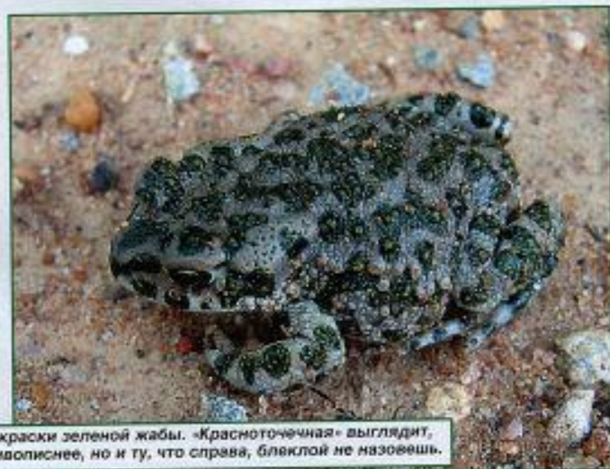
Варианты окраски зеленой жабы. «Красноточечная» выглядит, конечно, живописнее, но и ту, что справа, блеклой не назовешь.

ми и дармовыми для жаб «привлекателями и губителями» летающих насекомых.