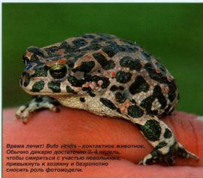
Время лечит! Bufo viridis – контактное животное. Обычно дикую достаточно 3-4 недели, чтобы смириться с участием невольника, привыкнуть к хозяину и безропотно сносить роль фото модели.

Перегрева можно не опасаться: жабы без видимых негативных последствий переносят повышение температуры до 30-35°C (а по некоторым данным, и до 40). По крайней мере, два последних жарких лета мои подопечные перенесли без ма-