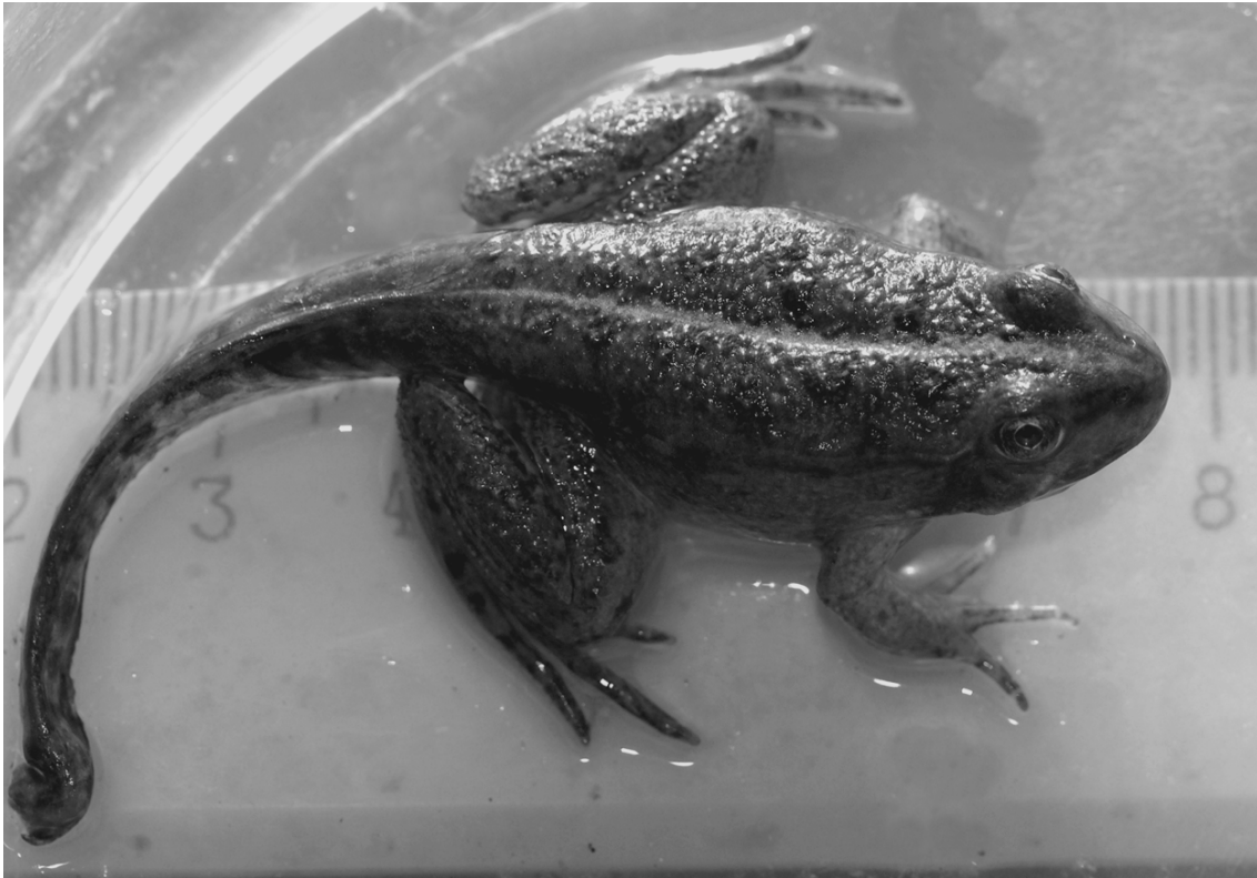
Рис. 1. Особь, завершающая метаморфоз (стадия 52), с длиной тела, близкой к максимальной (водоем “Паратунка”).

явились многочисленные головастики 39-й стадии, а в начале октября, были отмечены многочисленные мелкие метаморфы, относящиеся к более поздней (чем выявленные нами) когорте. Кроме того, 20 января 2007 г. наблюдали икротетание одной пары, а 3 февраля были обнаружены “4 кладки разных стадий развития” (Бухалова, Велигура, 2007, с. 56). В итоге, согласно наблюдениям в 2006–2007 гг., в этой популяции выявлено еще 4 когорты (зимняя, две весенних и одна осенняя), а всего, вместе с нашими данными, — 8 когорт. Отметим также, что пределы изменения температуры воды в 2006–2007 гг. (от 24 до 28°C — Бухалова, Велигура, 2007) совпадают с установленными нами, и, следовательно, температурный режим был стабильным и не мог изменять фенологию размножения.