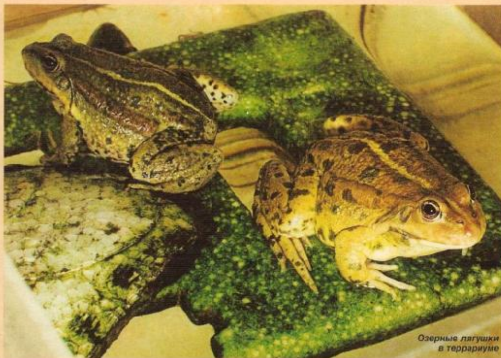
Озерные лягушки в террариуме

реться, понаблюдать за их поведением. Озерная лягушка как террариумное животное привлекательна своим внешним видом, крупными размерами, простыми условиями содержания и доступностью. Спорным остается вопрос о необходимости зимнего периода покоя. Если владельцу этого животного непременно хочется добиться размножения, то зимовка, видимо, необходима. Но это усложняет методику содержания. Да и зачем размножать в домашних условиях наш обычный вид? Достаточно иметь возможность наблюдать за ним, не отрываясь надолго от других своих забот. Я попытался содержать озерных лягушек при постоянных условиях круглогодично. Живут они в таких условиях вполне нормально. Однако это наверняка приведет к сокращению общей продолжительности жизни. Ведь зимовка у озерных