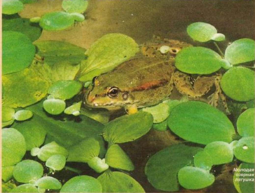
Молодая озерная лягушка

На другой день мы пришли снова, взяв с собой сачок и пару бапок. С помощью этой нехитрой амуниции мы поймали и принесли домой около полудтора десятков головастиков. Кстати, рыбки там тоже оказались (трехиглая колюшка). Головастиков мы посадили в аквариум и хорошо рассмотрели. Длинной они были 65-75 мм, довольно светлой коричневатой или кремовой окраски. Все имели зачатки задних ног. Попав в тепло, они начали интенсивно плавать и питаться. Кормили их таблетками крапивы, купленными в аптеке, и отварным, без соли, картофелем. За 2 ме-