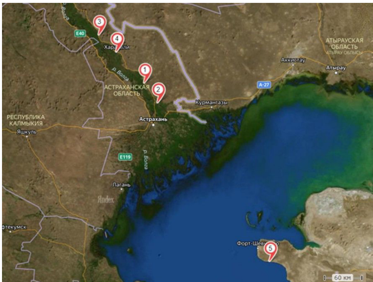
Рис. 1. Карта-схема мест отлова ужа водяного. Северный Прикаспий: 1 – Астраханская область, Красноярский район, пос. Комсомольский, с. Лапас; 2 – Астраханская область, Красноярский район, р. Ахтуба, пос. Белячий, с. Ясын-Сокан; 3 – Астраханская область, Харабалинский район, пос. Бугор, с. Михайловка; 4 – Астраханская область, Харабалинский район, г. Харабали. Восточный Прикаспий: 5 – Казахстан, Мангистауская область, окрестности с. Кызылозен

Fig. 1. Schematic map of Natrix tessellata trapping stations. Northern Pre-Caspian: 1 – village Lapas, settlement Komsomol'sky, Krasnoyarsky region, Astrahanskaya oblast'; 2 – v. Jasyn-Sokan, s. Belyachy, Krasnoyarsky region, Astrahanskaya oblast'; 3 – v. Mihaylovka, s. Bugor, Harabalinsky region, Astrahanskaya oblast'; 4 – Harabali city, Harabalinsky region, Astrahanskaya oblast'. Eastern Pre-Caspian: 5 – v. Kyzylozen, Mangistauskaya oblast', Kazakhstan