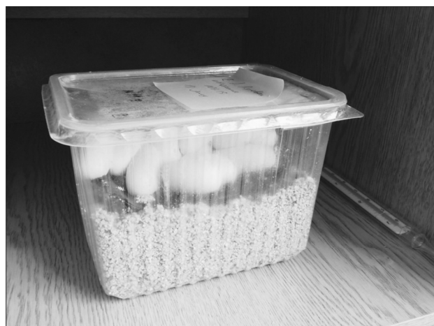
Рис. 2. Контейнер с кладкой узорчатого полоза

В 2012 г. данную методику применили для инкубации яиц узорчатого полоза. С учетом значительных размеров кладки этой змеи использовали одноразовые пищевые пластиковые контейнеры с крышками объемом 2 литра (рис. 2). 1/3 объема контейнера заполняли вермикулитом и на него помещали кладку на изолирующей пенопластовой кювете-подложке. Всего проинкубировано 12 кладок узорчатого полоза общей