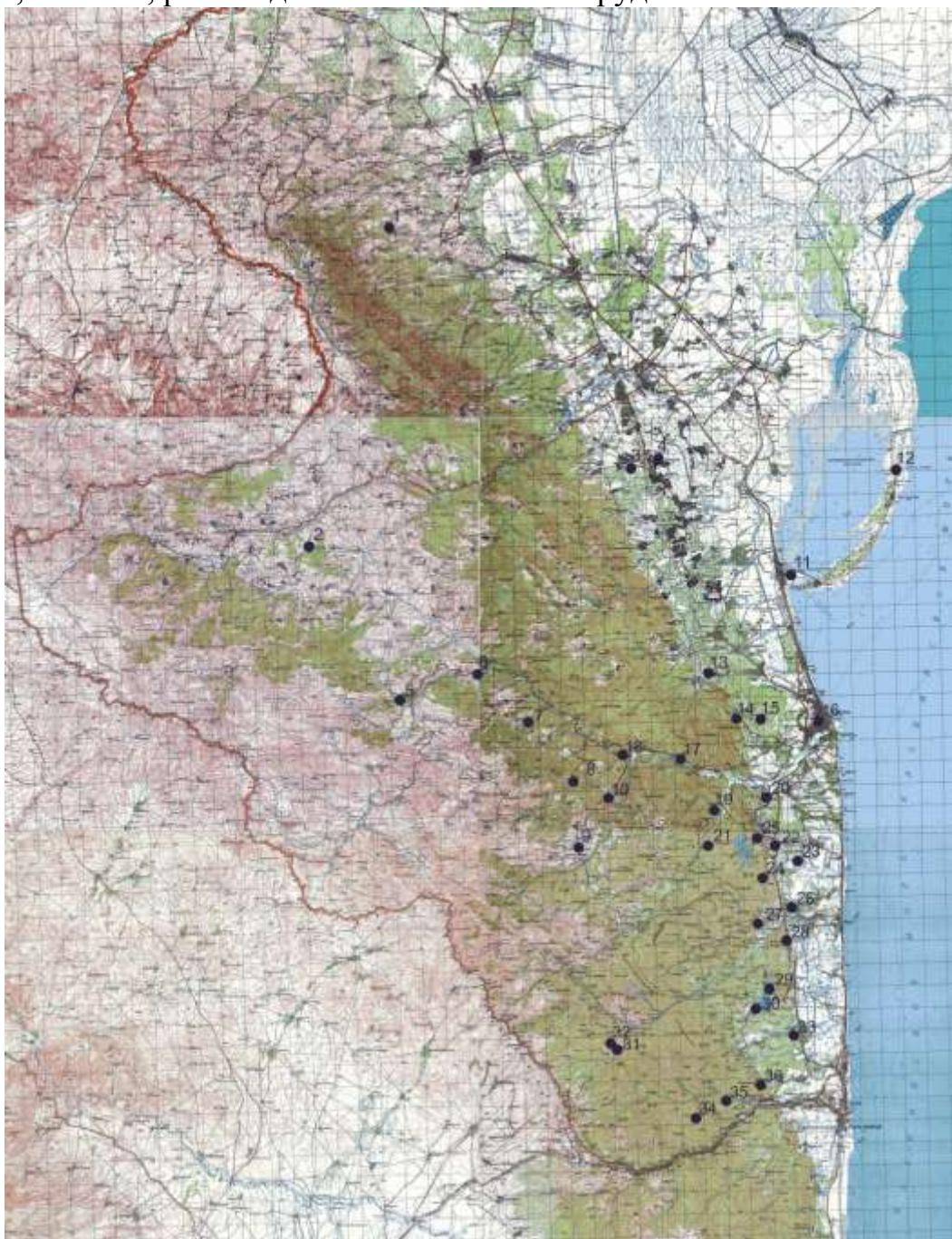
Рисунок 2 – Географическое распространение талышской жабы в юго-западном Прикаспии

lotus (Ebenaceae), мушмулой германской, Mespilus germanica , черешней дикой, Prunus avium , алычой, P. cerasifera , шиповниками, Rosa sp. (Rosaceae), падубом гирканским, Ilex hircana (Aquifoliaceae). В Ленкоранской низменности, уже к настоящему времени полностью лишенной естественных лесов, B. eichwaldi придерживается садов, лесополос, кладбищ, чайных плантаций, особенно при наличии водоемов, пригодных для размножения – арыков, каналов, рыбоводных и скотопойных прудов.