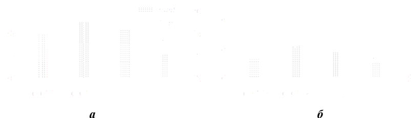
Рис. 4. Соотношение среднего количества брюшных и числа пар подхвостовых щитков у самцов ( а ) и самок ( б ) Vipera nikolskii из различных популяций в пределах ареала: ЮГЗУ, ЮГВУ – соответственно юго-западная и юго-восточная части Украины, СНП – Саратовская область и СП – Республика Татарстан

Анализ морфологических признаков рептилий позволил с высокой достоверностью ( p < 0.01 ) выявить по ряду показателей половой диморфизм, при этом максимальная длина туловища для большинства видов отмечена для самок. При сопоставлении данных по фolidозу рептилий из разных регионов в пределах ареала значимых отличий не обнаружено. Однако, например для гадюк Никольского и восточной степной, установлено, что при продвижении в направлении с юго-запада на северо-восток и с юга на север у змей наблюдаются некоторое увеличение числа щитков вокруг середины туловища ( Sq. ) и уменьшение количества брюшных щитков ( Ventr. ) (рис. 4, 5).