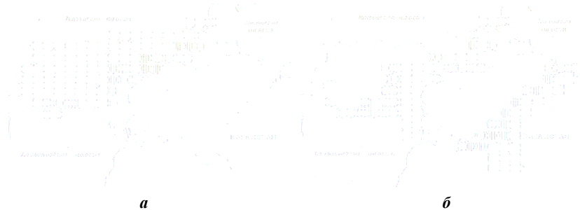
Рис. 2. Распространение гадюк Никольского (а) и восточной степной (б) на севере Нижнего Поволжья (в квадратах 25×25 км системы UTM). Условные обозн. см. на рис. 1

Как показали проведенные исследования, на территории севера Н. Поволжья обитают 12 видов рептилий, принадлежащих к 4 семействам, 10 родам. Примененная схема проекции Меркатора для исследуемой территории позволила наглядно продемонстрировать состояние герпетофауны данного региона. В процессе исследования детально изучено распространение и выявлена относительная численность рептилий, обитающих на данной территории. В качестве примера полученных данных на рис. 2 показано распространение гадюк Никольского и восточной степной. Кадастровые карты такого типа составлены по всем видам, когда-либо включавшимся в состав герпетофауны региона.