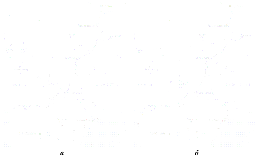
Рис. 5. Географическая изменчивость морфологических признаков восточной степной гадюки в Европейской части России: 1 – количество брюшных щитков, 2 – количество пар подхвостовых щитков, 3 – количество чешуй вокруг глаза, 4 – число предлобных щитков, 5 – отношение длины туловища к длине хвоста, 6 – отношение длины головы к длине пилеуса

Так, количество Ventr. у гадюки Никольского из юго-востока Украины в среднем больше 150-и для самцов и 154-х для самок. Тогда как на севере Н. Поволжья средние значения этого показателя несколько ниже (148.7 и 153.5 соответственно для самцов и самок). Минимальное число Ventr. характерно для изученных гадюк из Среднего Поволжья. Другие признаки фolidоза гадюк с севера Н. Поволжья и иных частей ареала варьируют в разной степени, между тем их анализ не позволяет выявить достоверных доказательств существования клинальной изменчивости.