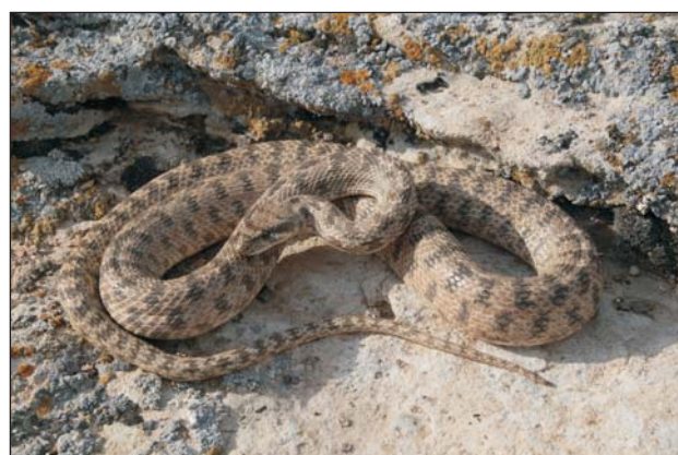
Рис. 2. Самка Spalerosophis diadema, обнаруженная в темное время суток на колонии больших песчанок в урочище Кендерли Устыуртского ГПЗ 24.05.2017 г. (точка 7 на рис. 1).

24.05.2017 г. в 22.00 во время ночного маршрута с фонариком в урочище Кендерли Устыуртского ГПЗ (точка 7 на рис. 1) на колонии больших песчанок Rhombomys opimus (Lichtenstein, 1823) авторами статьи была обнаружена крупная самка S. diadema ( L. = 1170 мм, L.cd. = 250 мм) (рис. 2). Утром следующего дня в 9.00 на той же колонии был отловлен взрослый самец S. diadema ( L. = 940 мм, L.cd. = 230 мм). 22.09.2017 г. примерно в 300 м от точки 7 в сухом колодце был обнаружен мертвый, частично разложившийся ювенильный экземпляр чешуелобого полоза.