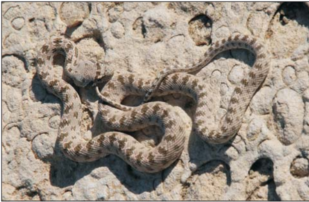
Рис. 3. Ювенильный экземпляр Spalerosophis diadema, обнаруженный на Западном чинке Устьурта на территории Устьуртского ГПЗ 21.09.2017 г. (точка 8 на рис. 1).

что территория заповедника включает в себя южную оконечность Западного чинка Устьурта на протяжении более 120 км, так и с большей степенью её изученности. Во всех случаях змеи были обнаружены на колониях песчанок или поблизости от них.