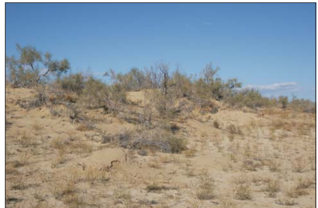
Рис. 5. Место обитания Spalerosophis diadema. Пески Карынжарык вблизи границы Устьуртского ГПЗ (точка 4 на рис. 1) 12.09.2016 г.

На территории РК S. diadema имеет тот же статус, что и желтобрюхий – Hierophis caspius (Gmelin, 1789) и Палласов – Elaphe sauromates (Pallas, 1811) полозы, включенные в Красную книгу РК (2010): все три вида встречаются здесь на границе своего обширного ареала на ограниченной территории, однако количество находок чешуелобого полоза в Казахстане несопоставимо меньше чем E. sauromates и сопоставимо с количеством находок H. caspius . На основании этого считаем необходимым включить S. diadema в «Красную книгу РК» в категории III – малоизученный вид, встречающийся на ограниченной территории.