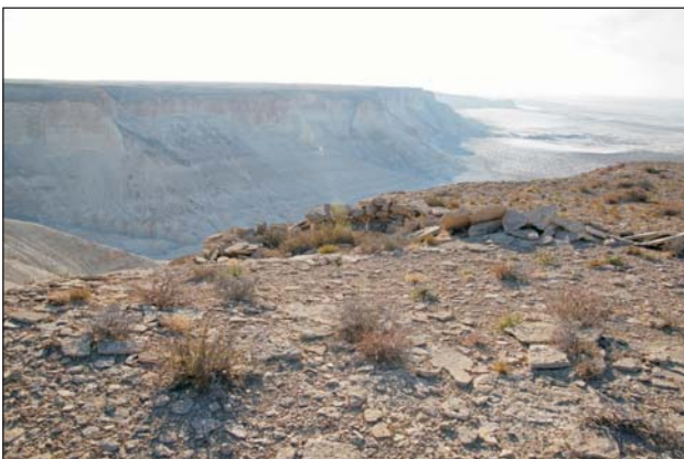
Рис. 4. Место обитания Spalerosophis diadema. Западный чинк Устьурта 10.10.2016 г. (точка 5 на рис. 1).