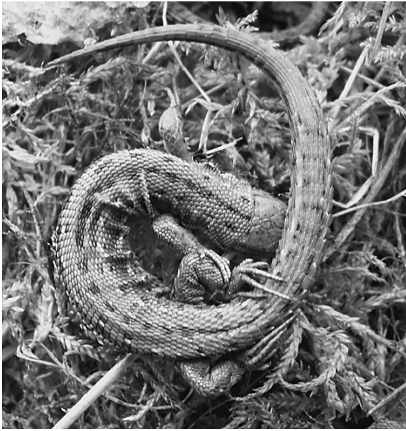
Рис. 2. Характерное положение тела живородящей ящерицы ( Z. vivipara ) при низких температурах среды.

под ними, а также неглубоко в почве. Открытая поверхность почвы (в том числе и под кусками коры) осматривалась ежедневно, но в течение двух последующих недель ящерицы здесь не встречались. В начале октября десять ящериц были обнаружены на поверхности почвы под кусками коры, все они были живы, но сильно поранены (со свежими укусами на шее или на голове, некоторые с поврежденными челюстями или глазами), часть из них — с аутомированными хвостами. Они были оставлены в вольере, и следующим утром под корой были найдены их однотипные останки: спина с конечностями и хвостом (если он не был аутомирован ранее) с практически неповрежденной на них кожей, голова же и внутренности были съедены. При разборе вольеры в толще мха обнаружено гнездо какого-то грызуна, выложенное березовыми листьями, с 5 новорожденными детенышами, а в почве — его ход диаметром не более 2 см. Здесь же среди мха у гнезда обнаружены останки еще нескольких ящериц.