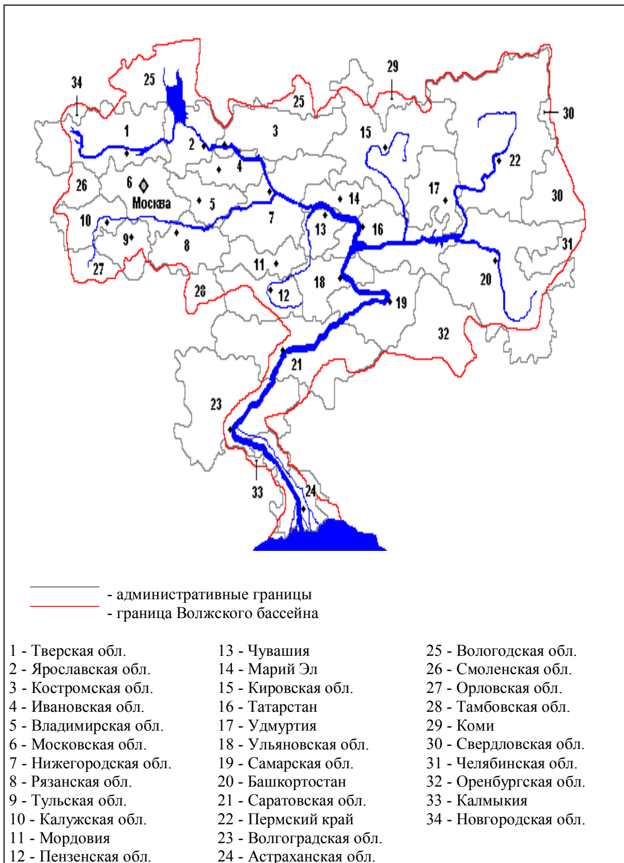
Рис. 1. Административное деление территории Волжского бассейна (по: Розенберг, Краснощеков, 1996; с учетом последних изменений названий административных единиц)